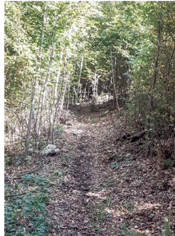
Nach rigorosem Eingriff ist der Weg wieder gut begehbar.