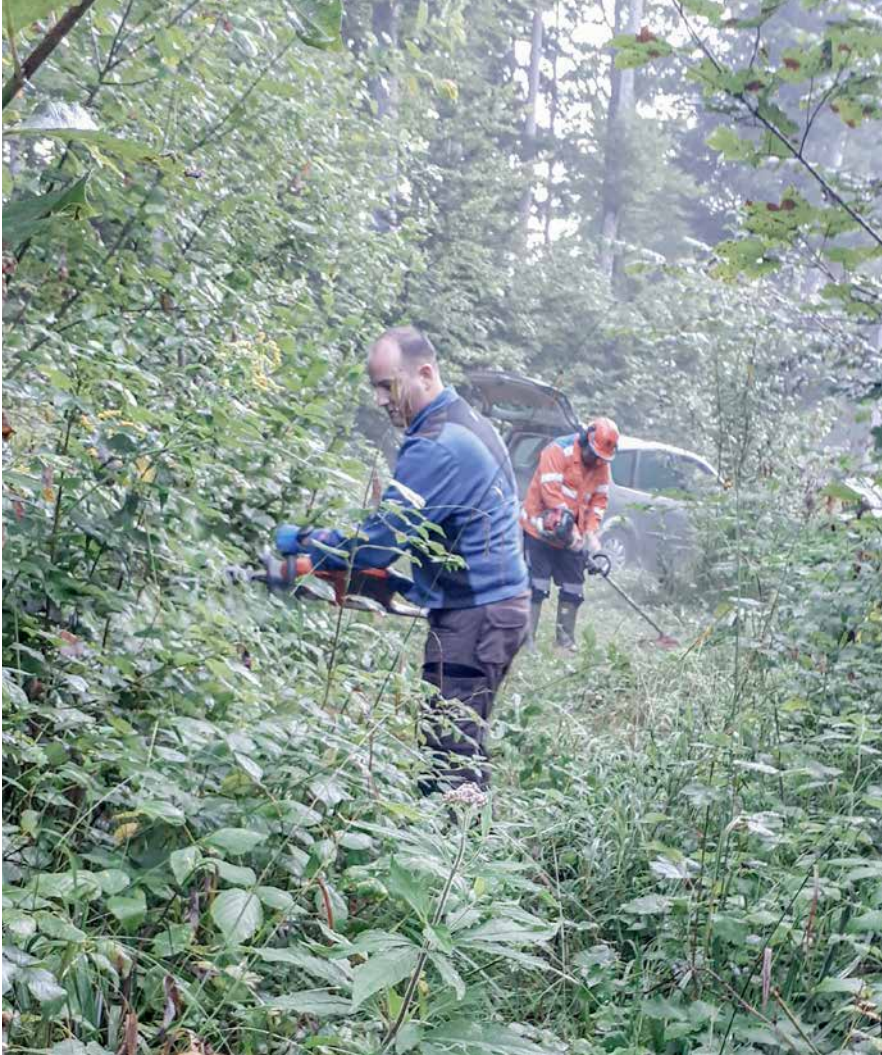
Nun tritt die Waldarbeitsgruppe in Aktion.